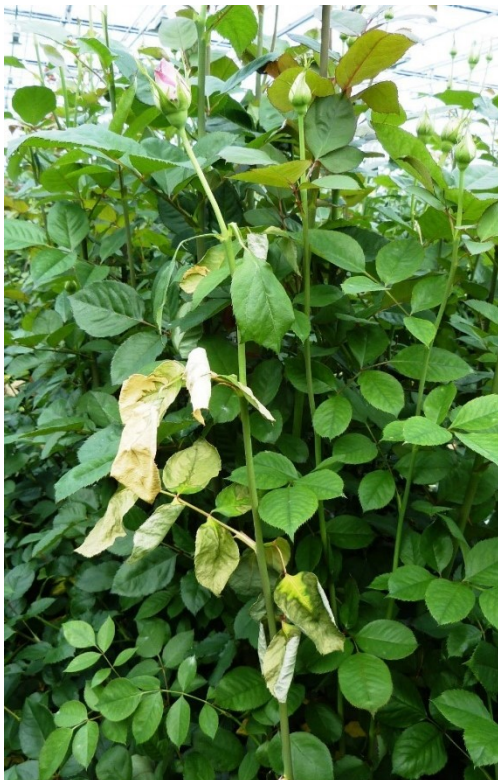
Verwelking bij Rosa door Ralstonia .

Symptomen komen voor beiden soorten bacteriën overeen. Verwelking van (delen van) de plant kan wijzen op infectie met Ralstonia . Ook veel andere ziektes veroorzaken verwelking. Een gevorderde infectie met Ralstonia veroorzaakt ook crème/bruin verkleurde plekken op stengel en wortel waaruit bij beschadiging soms crème wit (bacterie)slijm komt. Voor meer details van de symptomen bij aardappel zie het NVWA webdossier bruinrot .