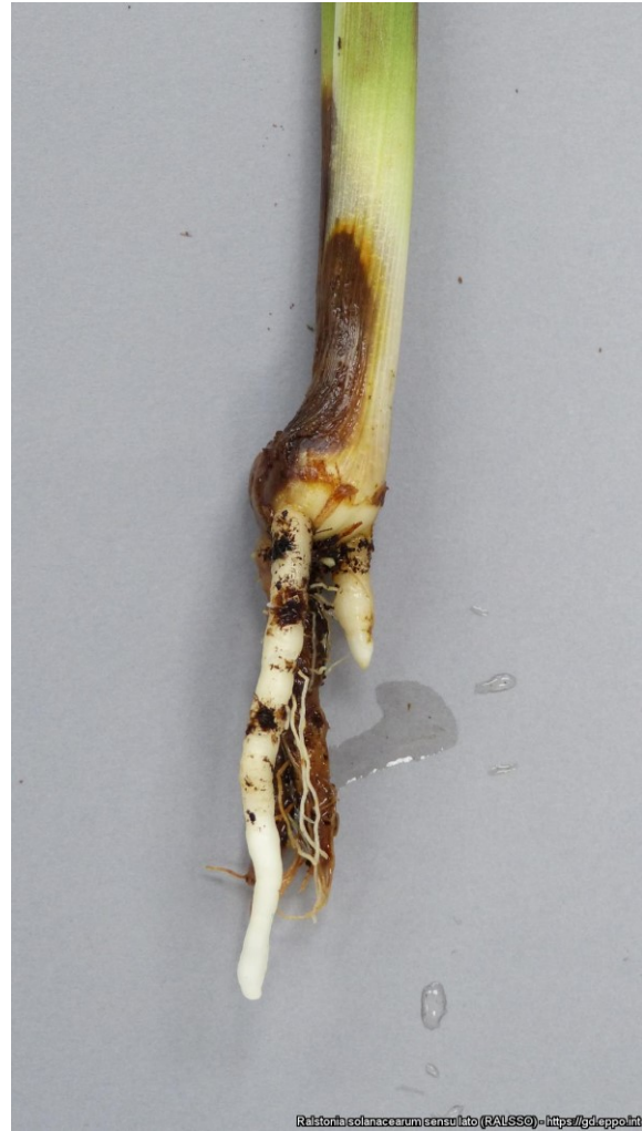
Bruine plekken op stengelbasis en wortel bij Curcuma-plant door Ralstonia .