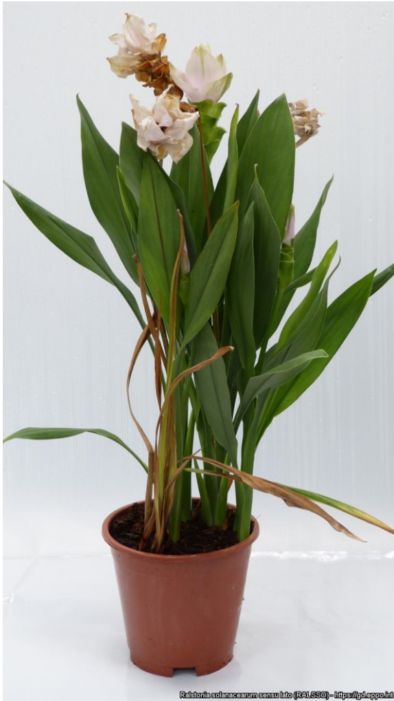
Verwelking bij Curcuma-plant door Ralstonia .