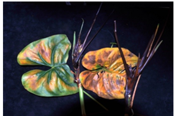
Symptoom van Ralstonia op Anthurium.

In de aardappelknol is na doorsnijden een bruinverkleuring van de vaatbundelring zichtbaar. Onder vochtige omstandigheden kunnen daarop na enige tijd crème witte slijmdruppels ontstaan.